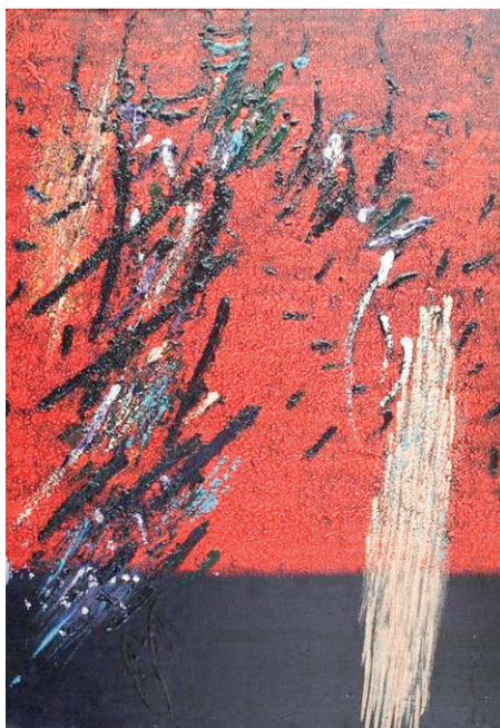
Rajmund Ziemiński, Pejzaż 28/80, 1980, akryl na płótnie, 116 x 81 cm, Własność Muzeum im. Jacka Malczewskiego

– Rodzina bardzo dba o spuściznę po malarzu. Zachowana została, na przykład, jego warszawska pracownia. Duże pomieszczenie z antresolą, pełne prac Rajmunda Ziemińskiego. Zaschnięte farby, pędzle, na ścianach plakaty z wystaw artysty. Niesamowicie klimatyczne miejsce – opowiada kustosz w Dziale Sztuki MJM.