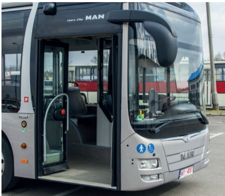
Fot. archiwum orszadzieli

REGION RADOMSKI. Dopłaty z Funduszu Rozwoju Przewozów Autobusowych o wartości ponad 1,2 mln zł pozwolą samorządom z regionu na uruchomienie 38 połączeń lokalnych o łącznej długości 848,4 km.