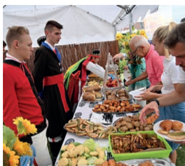
Dla starszych produkty tradycyjne i regionalne