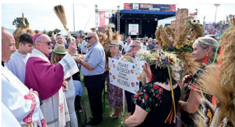
Za najładniejszy wieniec dożynkowy uznano w tym roku wieniec z Powiatu Siedleckiego