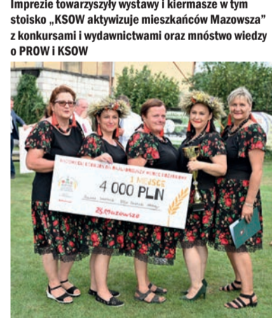
Rozstrzygnięto m.in. konkursy na najładniejszy wieniec dożynkowy

Zapraszamy do śledzenia strony mazowieckie.ksow.pl oraz naszego profilu WIĘŚCI z MAZOWSZA w mediach społecznościowych ( Facebook i YouTube)!