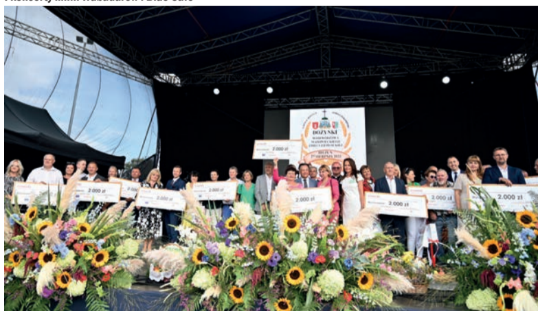
Rozstrzygnięto konkurs na najaktywniejsze sołectwo KSOW – Sukcesy widać po sąsiedzku