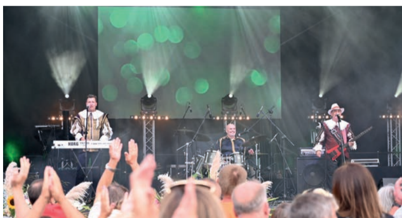
I koncerty m.in. Trubadurów i Blue Cafe

Konkurs był zorganizowany ze środków Pomocy Technicznej PROW 2014-2020, a środki już wkrótce trafią na konta wskazane przez gminy i z całą pewnością dobrze posłużą lokalnym społecznościom.