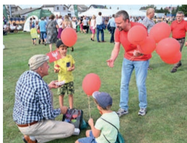
Dla najmłodszych mieliśmy m.in. opaski i kamizelki odbłaskowe, balony i słodycze