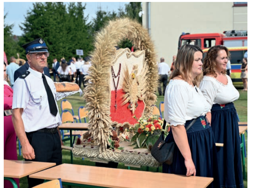
Wśród stylów wieńców dożynkowych dominowały elementy patriotyczne i religijne

Miejsce trzecie i nagrodę 2.000 zł zajął wieniec wykonany przez: POWIAT OSTROŁĘCKI. Drugie miejsce i nagrodę 3.000 zł otrzymał POWIAT GOSTYNIŃSKI. Natomiast miano najładniejszego wieńca w stylu tradycyjnym oraz nagrodę 4.000 zł w tym roku zdobył wieniec wykonany przez KGW DWÓRKI HELENY z HELENOWA w POWIECIE SIEDLECKIM!