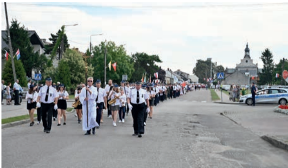
Korowód wieńców prowadziła Orkiestra Dęta OSP Bieżuń