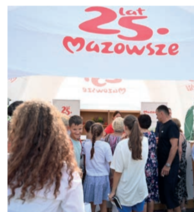
Imprezie towarzyszyły wystawy i kiermasze w tym stoisko „KSOW aktywizuje mieszkańców Mazowsza” z konkursami i wydawnictwami oraz mnóstwo wiedzy o PROW i KSOW