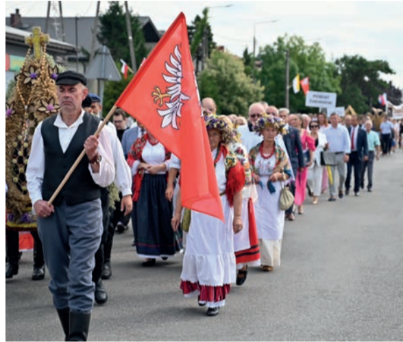
Przepiękne wieńce, stroje ludowe, powiewające flagi – to wszystko przemaszerowało ulicami Bieżunia