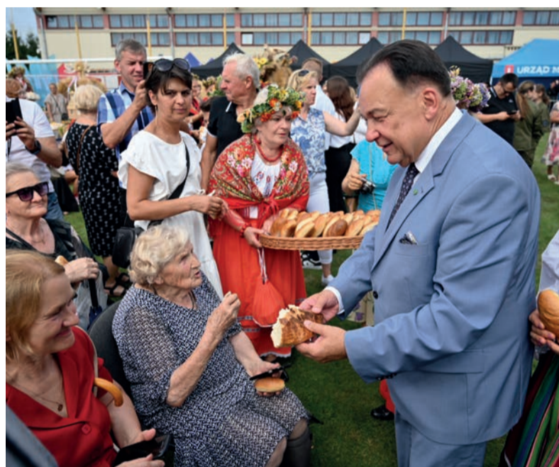
Na Dożynkach nie zabrakło tradycyjnej ceremonii dzielenia chlebem