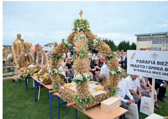
Wieniec Wojewódzki przygotowało Miasto i Gmina Bieżuń

I miejsce zajęło Sołectwo Pętkowo Wielkie w Gminie Zaręby Kościelne „Utworzenie świetlicy wiejskiej miejsca integracji i rozwoju w sołectwie Pętkowo Wielkie”. Nagroda: 4.000 zł.