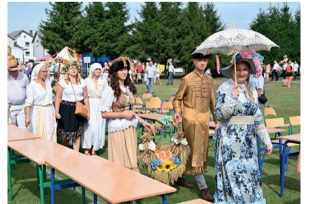
Wieńcom towarzyszyły Delegacje Powiatowe – niektóre bardzo ciekawie ubrane