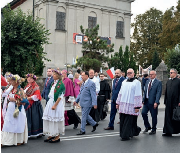
Dożynki Województwa Mazowieckiego i Decyzji Płockiej Bieżuń 2023 rozpoczął korowód wieńców

27 sierpnia, słońce, boisko przy Zespole Szkół w Bieżuniu i wielki pokłon pracującym w rolnictwie!