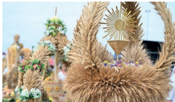
Wieńce były przepiękne i finezyjne