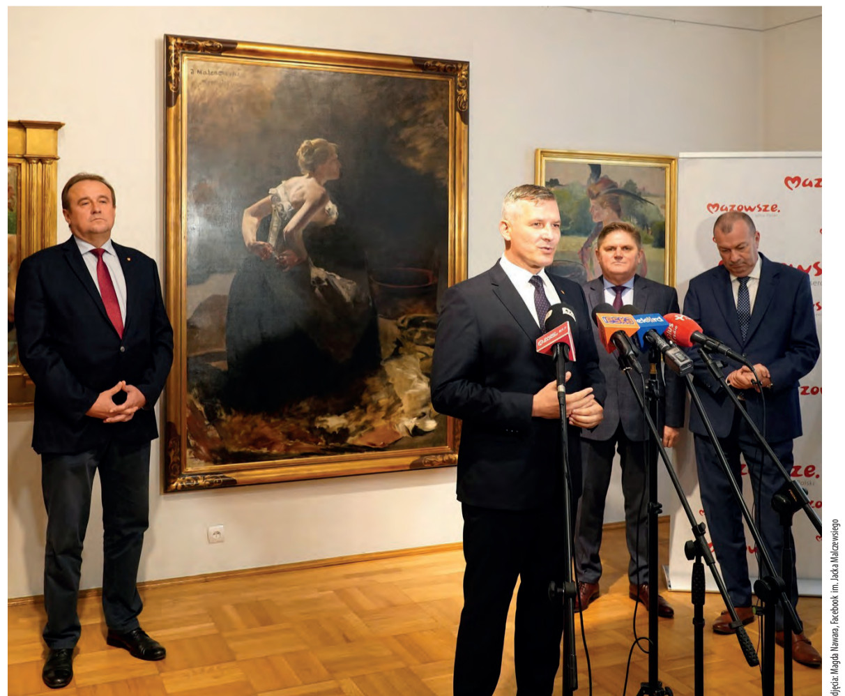
Zdjęcia: Magda Nawara, Facebook (im. Jacka Malczewskiego)