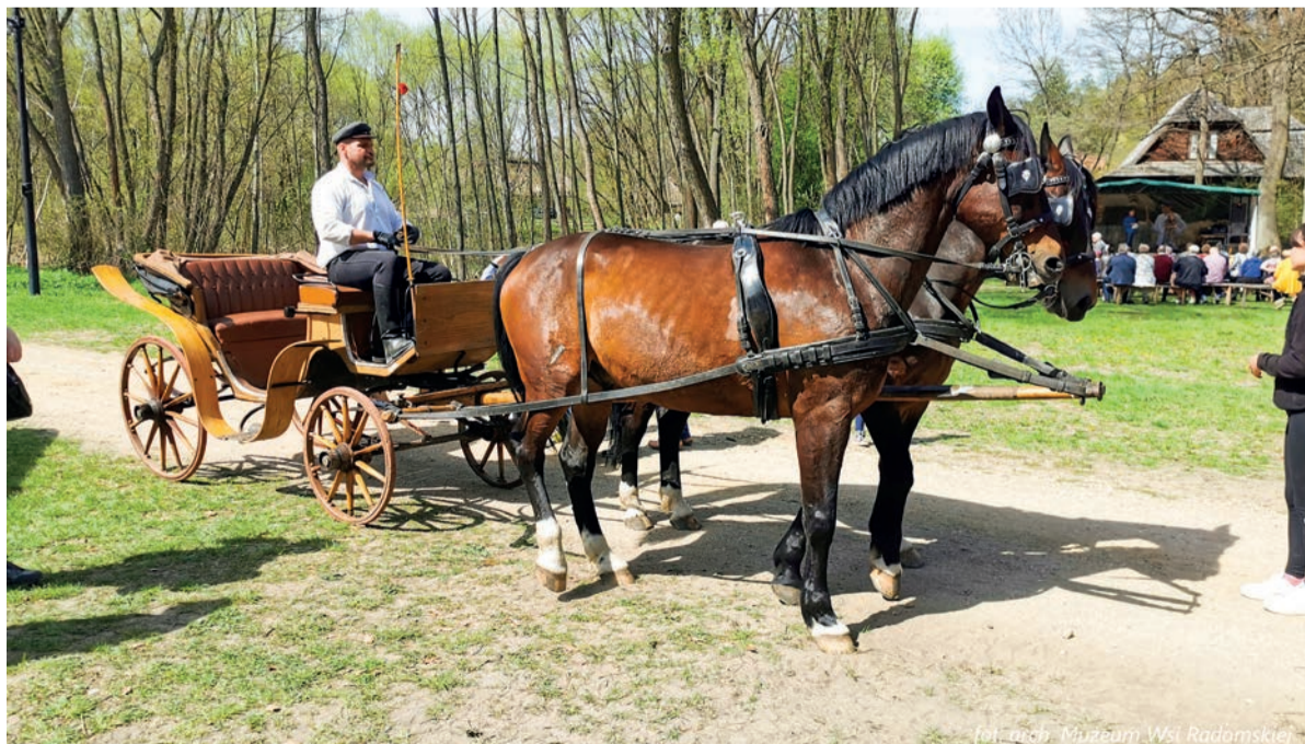
Muzeum Wsi Radomskiej 3 maja zaprasza na wydarzenie „Koń w tradycji polskiej”