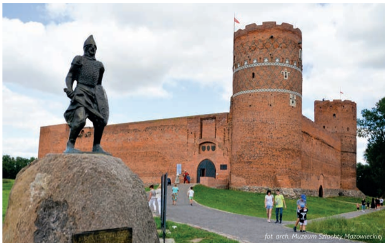
Wystawy i koncert Piotra Rubika – to propozycje Muzeum Szlachty Mazowieckiej

Przed nami długi weekend majowy. A na Mazowszu nie brakuje miejsc, w których można się zrelaksować, podziwiać piękne widoki i spróbować przysmaków lokalnej kuchni. Specjalne atrakcje przygotowały mazowieckie skanseny, muzea czy zamki. Majówka to idealny czas na krótkie podróże w nieznane zakątki Mazowsza!