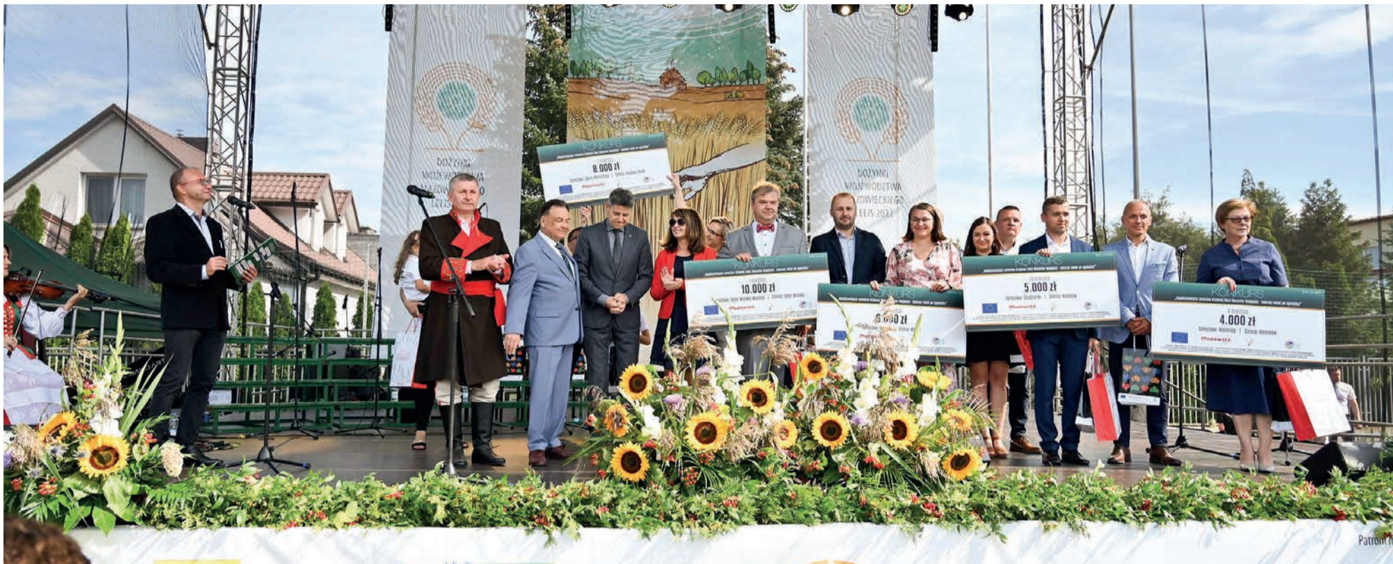
Ubiegłoroczni laureaci konkursu na scenie Dożynek Województwa Mazowieckiego Lelis 2022.