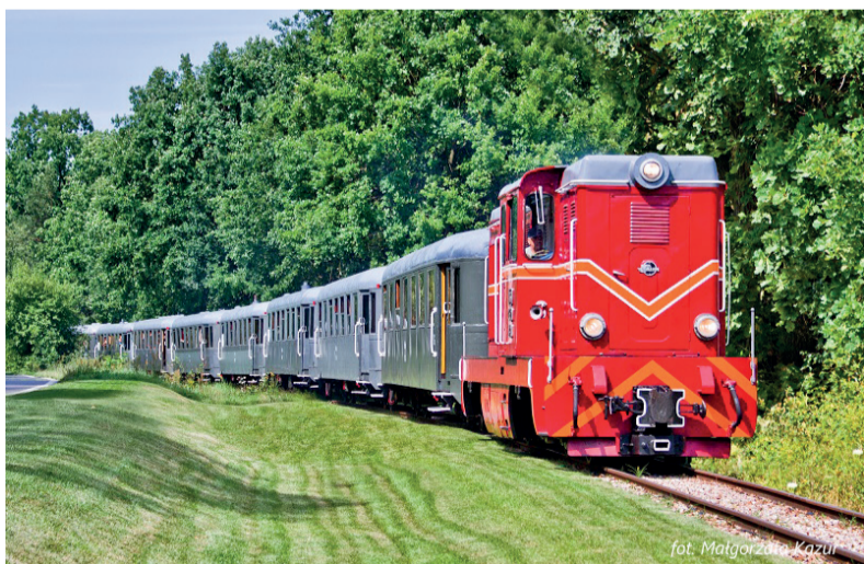
Już 29 kwietnia turyści znów pojadą pociągiem Retro do Puszczy Kampinoskiej!

Na świętowanie 232. rocznicy uchwalenia Konstytucji 3 maja zaprasza także warszawskie Muzeum Niepodległości. Uroczystości rozpoczną się o godz. 11. Zaplanowano wydarzenie historyczno-artystyczne „Pro Bono Poloniae” obejmujące prelekcję historyczną wraz z prezentacją multimedialną i koncert piosenek, które powstały „ku pokrzepieniu serc”.