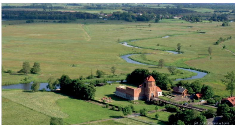
Wybierając się na majówkowy odpoczynek do Doliny Liwca, warto zajrzeć do zamku