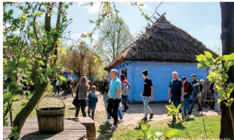
W Muzeum Wsi Mazowieckiej w Sierpcu 1 i 3 maja odbędzie się wielka majówka wzorowana na dawnych biesiadach na powietrzu

Dolina Liwca to idealne miejsce na wypoczynek na łonie natury – spływ kajakowy, wycieczkę rowerową czy spacer brzegiem rzeki. Zamek w Liwie to z kolei prawdziwa gratka dla fanów historii. Mieszczące się w nim Muzeum Zbrojownia liczy ponad 900 eksponatów – od militariów, przez obrazy, po