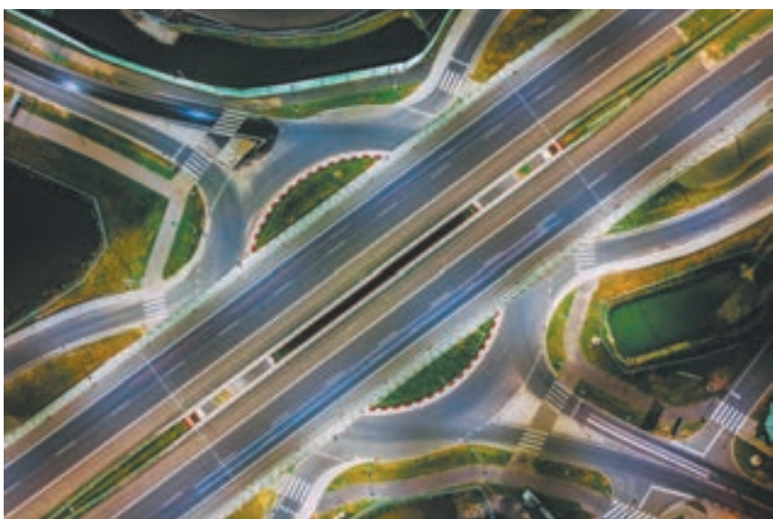
...przez Piotra Nowakowskiego